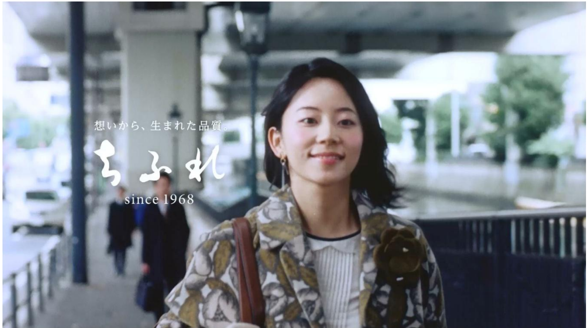
ちふれ 新TVCM『ちふれ ポイントメイク 自由篇』（15秒）より