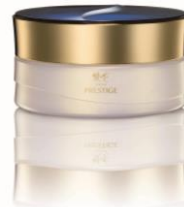
綾花 シルキー フェース パウダー （おしろい） 内容量 20g 本体価格 各3,500円（税抜） 全2色

※スポンジ別売り 綾花 エレガント クリーム ファンデーション スポンジ 本体価格 500円（税抜）