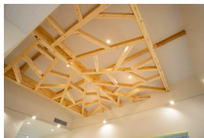
解放感ある吹き抜け