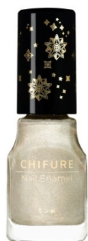
018 ゴールド系ラメ 強く輝く メタリックゴールド

『ちふれ ネイル エナメル 018、019、546、573』（限定色4色 / 全53色+限定色4色） 各495円（本体価格：450円）