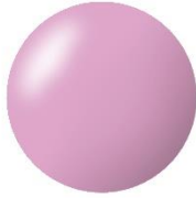
349 パープル系 華やかさも纏う 絶妙大人ラベンダー