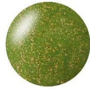
820 グリーン系ラメ 原色トーンにラメが潜んだ、 ポップ×ゴージャスなグリーン系ラメ