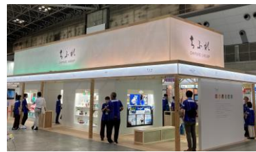
昨年の出展ブースの様子

当社は昨年、より多くの方に「ちふれグループ」の商品開発の歴史や展開ブランド、持続可能な社会の実現に向けた取り組みなど、グループの存在意義を知っていただきたと考え、初めてドラッグストアショーに出展いたしました。また、日々の暮らしに寄り添う商品をつくり続けている「ちふれ」のブランドイメージを基に、“ちふれの家”をイメージしたブースデザインで、来場者一人ひとりをおもてなしの心でお迎えし、期間中に実施されたブースコンテストでは、出展社400社中第2位となる「準大賞」を受賞いたしました。