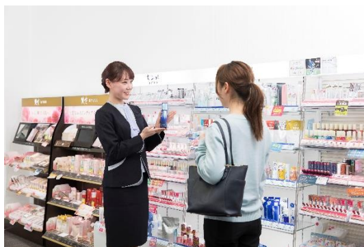
売場接客のカウンセリング時のイメージ