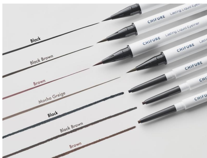
『ちふれ ラスティング リキッド アイライナー』 『ちふれ クリーミー ジェル アイライナー』